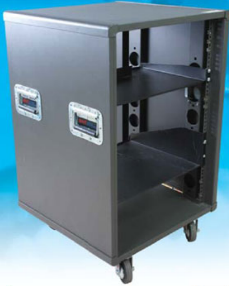
Move Rack 19" MR-16U