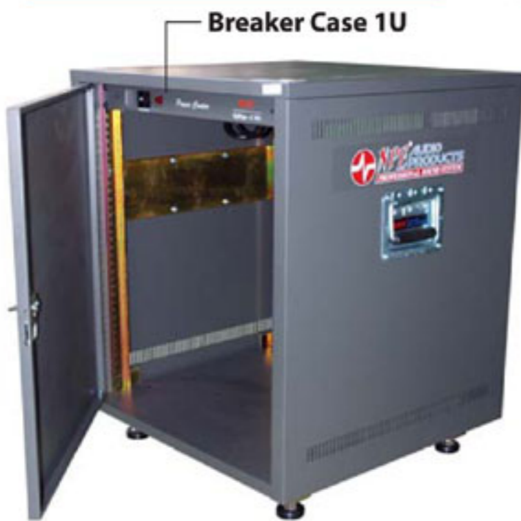
Quick Rack 19" With Panel QRp-13U