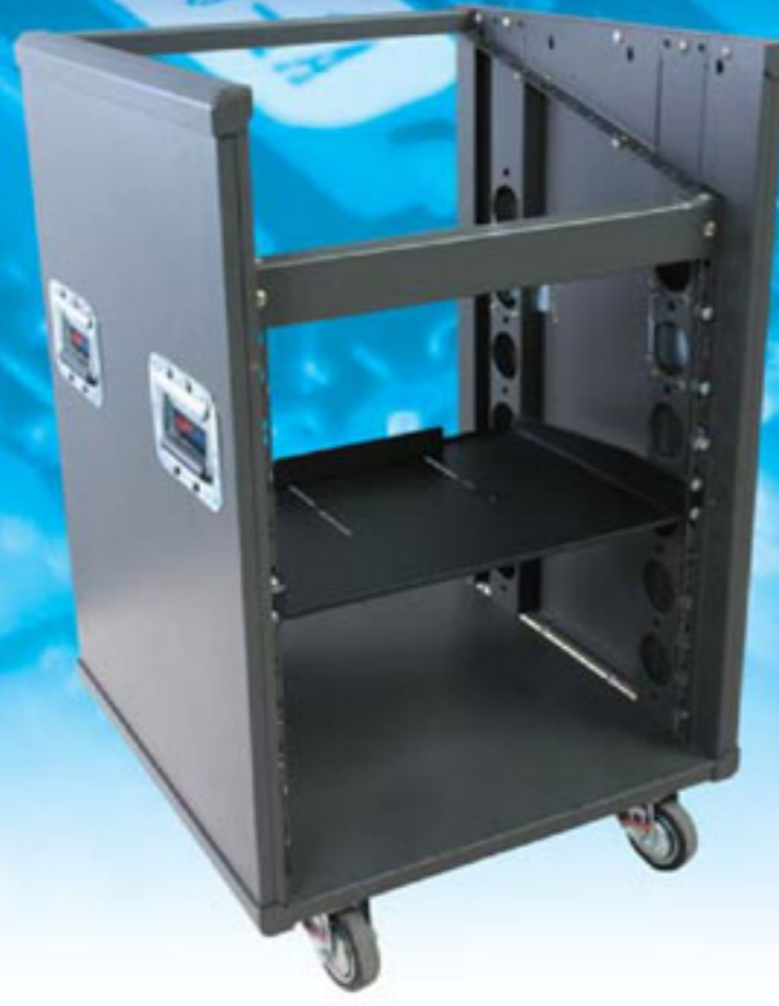
Move Rack 19" With Mixer MRm-12U