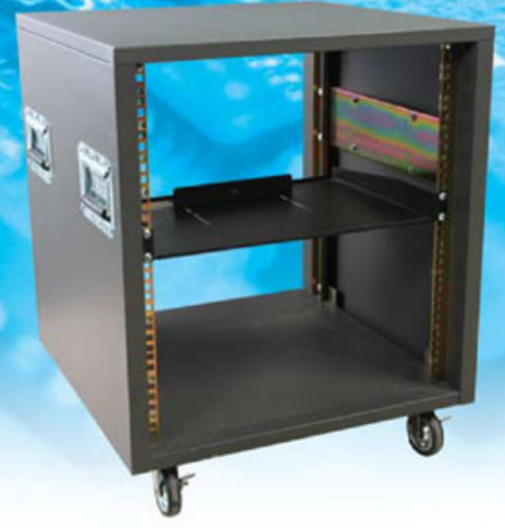
Quick Rack 19" QR-12U